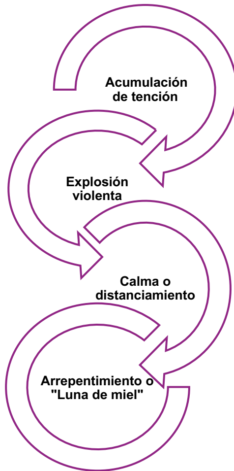
Ilustración 2. Ciclo de la violencia. Elaborado por el Área de Bienestar Institucional. INFOTEP. 2026. Fuente: Morabes, Sabrina del Carmen. (2014). Ciclo de violencia en la asistencia psicológica a víctimas de violencia de género [Conferencia]. Jornadas de género y diversidad sexual (GEDIS) Universidad Nacional de la Plata. http://sedici.unlp.edu.ar/handle/10915/42960 & Walker, L. E. (1979). The Battered Woman. Harper & Row.